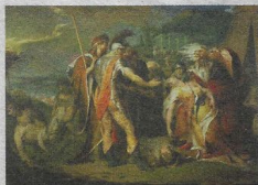
James Barry: King Lear bewent de dood van Cordelia (1786).